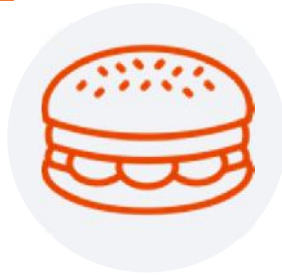
Bruto-netto Cafeteria model