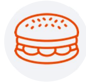
Bruto-netto Cafeteria model