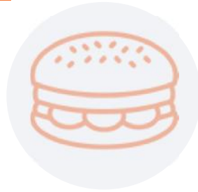
Bruto-netto Cafeteria model