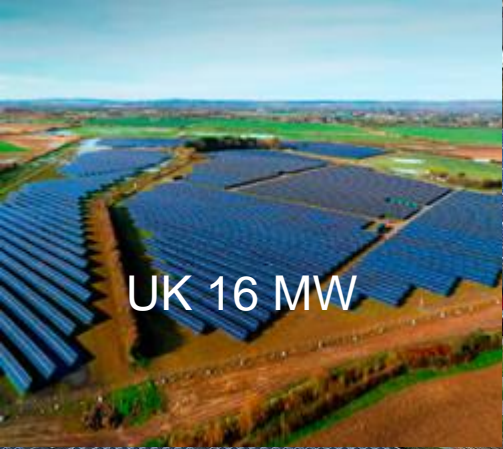
UK 16 MW