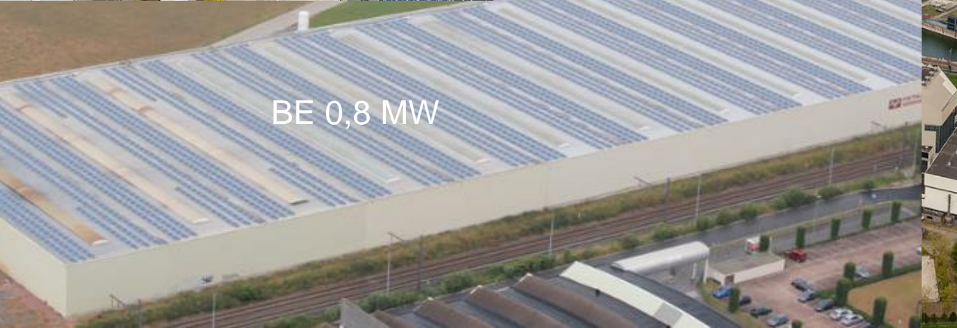
BE 0,8 MW