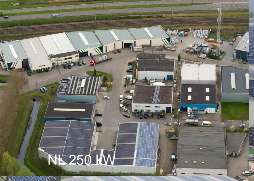
NL 250 kW