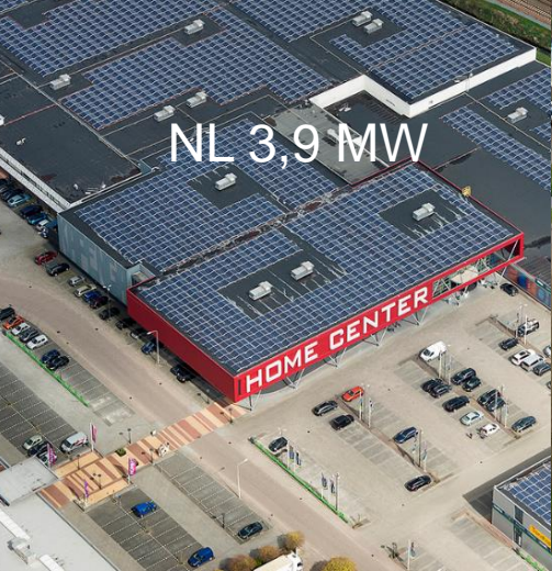
NL 3,9 MW