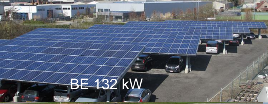
BE 132 kW