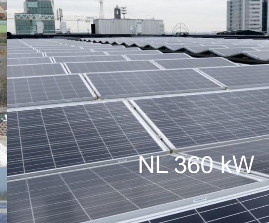
NL 360 kW