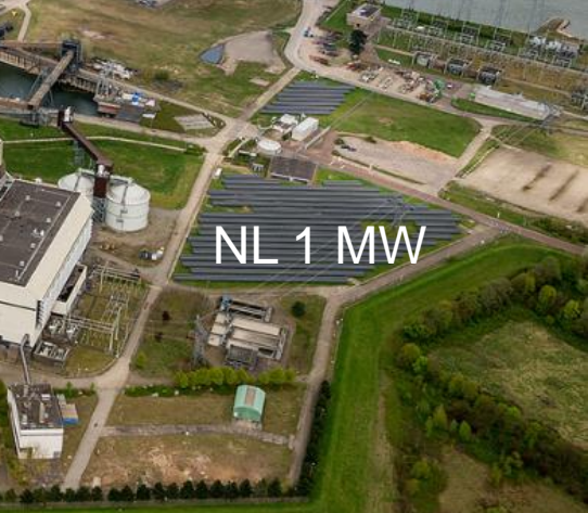
NL 1 MW