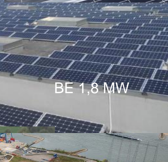
BE 1,8 MW