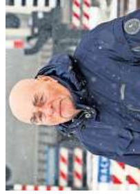
'Het komt hier totaal vast te zitten. Het dorp dreigt onbereikbaar te worden, ook voor hulpdiensten'

De gebiedscommissie — de orren en ogen van de gemeenschap — is de afgelopen tijd bezig de gevolgen van de brexit te onderzoeken. Drie brieven heeft de commissie over de brexit naar Harwich verzonden.